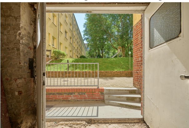
Unverbautes Souterrain gewährleistet viel Helligkeit