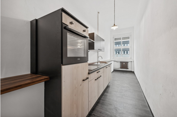
Küche im 1. OG