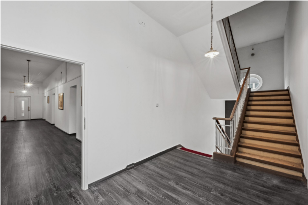
Treppenaufgang im 1. OG