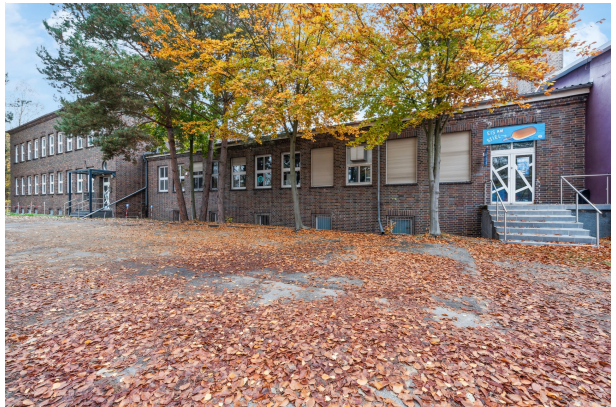
Gebäudeansicht von der Seite