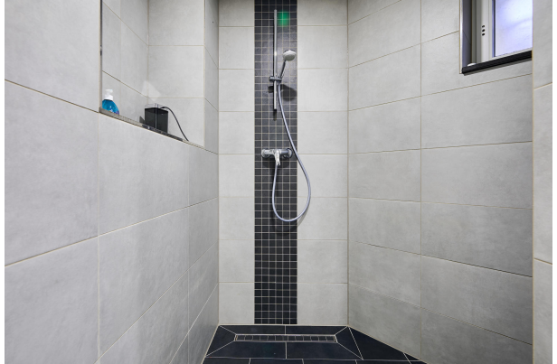
Ca. 160m 2 Souterrain mit Baugenehmigung