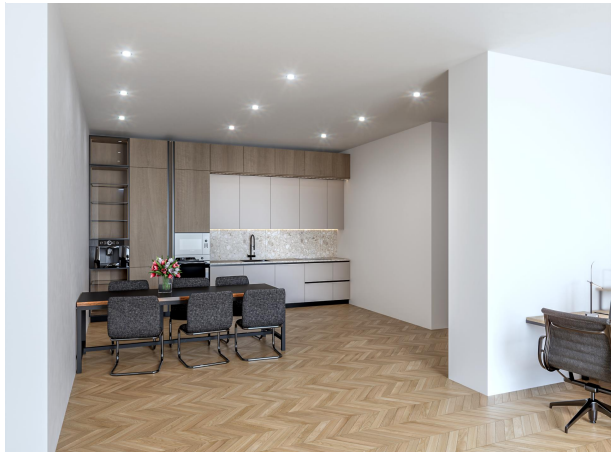
Möglicher Büroumbau, bereits genehmigt