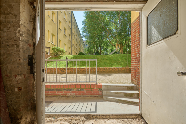
Unverbautes Souterrain gewährleistet viel Helligkeit