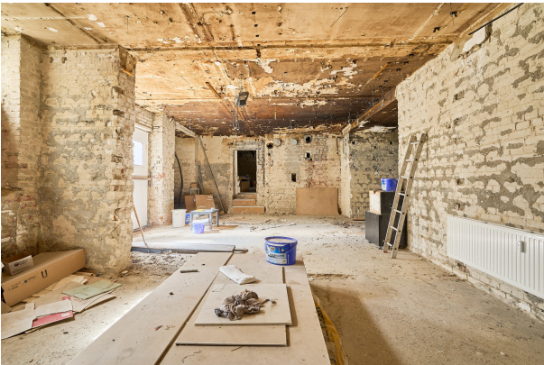
Ca. 160m 2 Souterrain mit Baugenehmigung