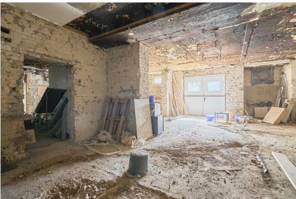
Bis zu ca. 3m Deckenhöhe